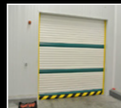
Portes enrrollables amb lona aïllada per cambres refrigerades