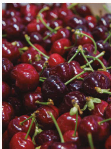
FRUITES I HORTALISSES. El canvi de cobertes serà progressiu i començarà pels pavellons E i F

En els darrers anys, el producte de proximitat està agafant embranzida i protagonisme, gaudint d'un alt reconeixement entre bona part dels consumidors. El Baix Llobregat, comarca de tradició pagesa, organitza entre els mesos d'abril i juny diverses fires agrícoles a municipis de la zona per posar en valor aquests productes i la seva qualitat. Un any més, Mercabarna ha donat suport a les fires de l'Espàrrec de Gavà, de Sant Isidre de Viladecans, de la Cirera d'El Papiol i de Torrelles de Llobregat i ha obsequiat els agricultors participants amb materials i eines per treballar el camp. ●