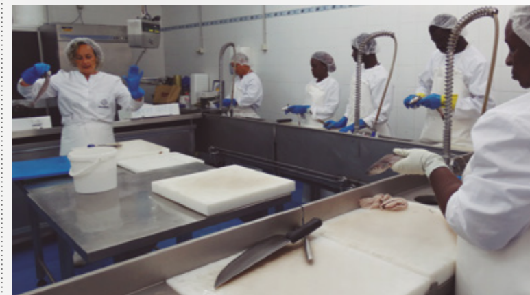
◀ FORMACIÓ. La formació en peixateria es realitza en una de les aules del Mercat Central del Peix

Un altre dels col·laboradors en aquesta iniciativa és la Fundació Busquets. L'entitat s'encarrega de recollir el peix i marisc que s'utilitza a les classes pràctiques, per repartir-lo a menjadors socials i famílies necessitades. ●