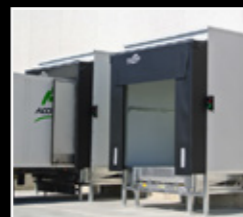
Abric flexible d'espuma i abric inflable