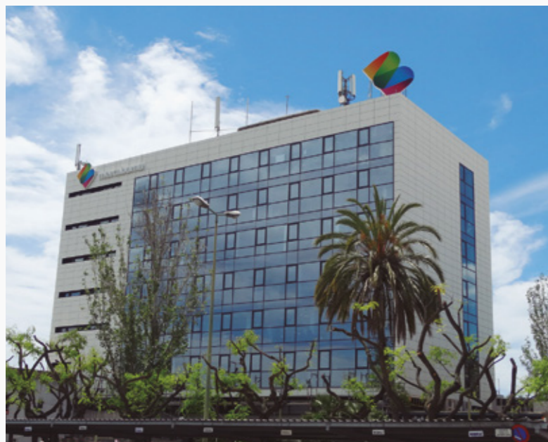
◀ DIA A DIA. La façana reformada del Centre Directiu

La urbanització de la plaça de la zona comercial i la renovació de l'edifici directiu són algunes de les obres que s'estan duent a terme.