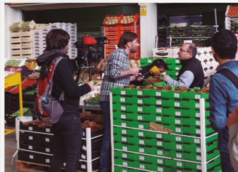
◀ DIA A DIA. El monòleg del programa es va gravar al pavelló F del Mercat Central de Fruites i Hortalisses