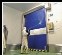
Portes ràpides autoencarrilables