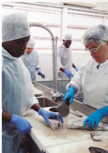
▶ FORMACIÓ. Els alumnes formen part del projecte "Formació en Empresa" del Casal dels Infants del Raval

El passat 22 de març un grup d'estudiants de cuina van participar en una jornada formativa de peixateria a Mercabarna. Els nou joves que van assistir al curs formen part del projecte "Formació en Empresa", una iniciativa que lidera el Casal dels Infants del Raval per millorar les oportunitats d'inserció laboral entre els joves que estan en risc d'exclusió social. Amb l'ajuda de dues docents dels Serveis de Formació, els alumnes van iniciar-se en la manipulació de diversos tipus de peixos i van poder realitzar exercicis pràctics. ●