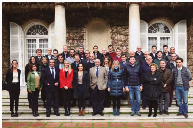
◀ FORMACIÓ. Els participants al curs de l'IESE

seves companyies. A través d'una metodologia variada –amb activitats com l'anàlisi de casos concrets, tutories, conferències, col·loquis i tallers–, els 35 alumnes han pogut desenvolupar capacitats com l'autoavaluació estratègica dels projectes i de les oportunitats i la planificació del creixement. D'altra banda, també s'ha volgut incentivar la generació de noves idees i negocis, dos elements imprescindibles per a l'èxit empresarial. ●