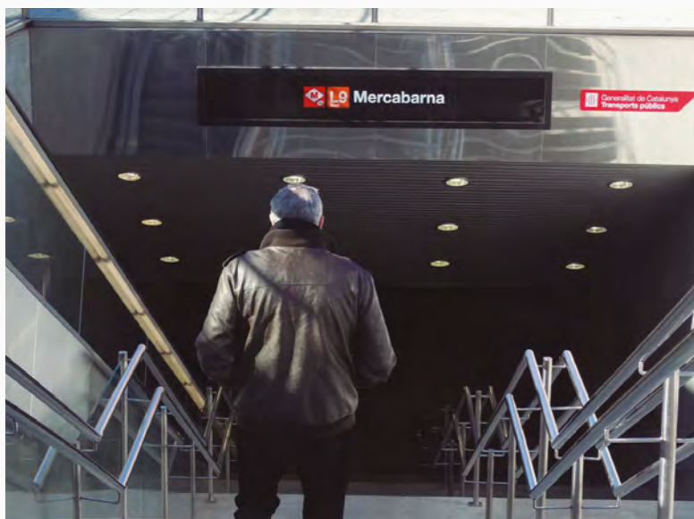
DIA A DIA. Cada cop hi ha més usuaris que utilitzen el metro per accedir a Mercabarna

En el marc del Pla de Mobilitat de Mercabarna, s'ha habilitat un recorregut per als vianants des de l'estació de metro, ubicada a la porta K, fins a l'interior del recinte. Les accions han inclòs la millora i construcció de noves voreres i de passos de zebra als carrers Longitudinal 8 i Transversal 6 i 8. L'objectiu d'aquestes actuacions és la de garantir que els desplaçaments a peu siguin més segurs i confortables per als usuaris que utilitzen aquest mitjà de transport. ●