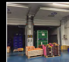
Portes seccionals sandvitx 80mm per cambres refrigerades