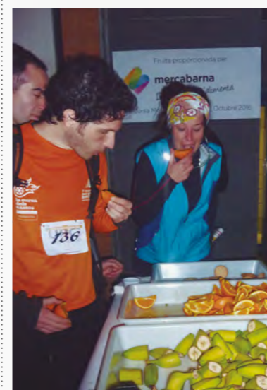
DIA A DIA. L'avaluament de la cursa NoXturna, amb fruita cedida per Mercabarna

En segon lloc, el diumenge 20 de març la plaça del Fòrum va acollir la "Festa&Teca", una festa ciutadana concebuda per a la promoció dels hàbits de vida saludables, a la qual van assistir més de 6.000 persones. La jornada, impulsada pel Museu Blau i l'Institut de Mercats Municipals, estava dirigida a petits i grans, que van poder realitzar activitats relacionades amb l'alimentació, la gastronomia o l'agricultura. En aquest cas, Mercabarna, va aportar fruita per als participants de la festa i broquetes de fruita per a un taller infantil. ●