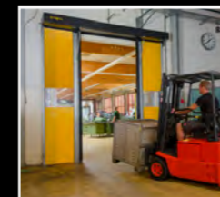
Portes súper ràpides 5 m/s d'obertura horitzontal