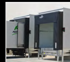
Abric flexible d'espuma i abric inflable