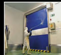
Portes ràpides autoencarrilables