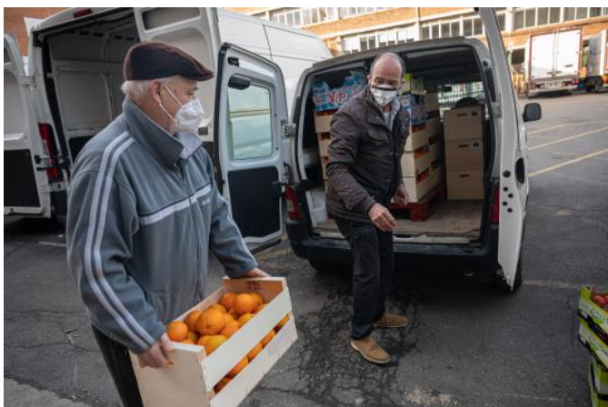
Tareas de transporte en el Banc dels Aliments de Barcelona

Este crecimiento generado por la covid también fue acompañado del aumento de los alimentos recuperados, que evitó el malgasto de 10 millones de kilos. En este sentido, los principales canales de recuperación fueron la industria agroalimentaria, las cooperativas agrarias, los supermercados y Mercabarna.