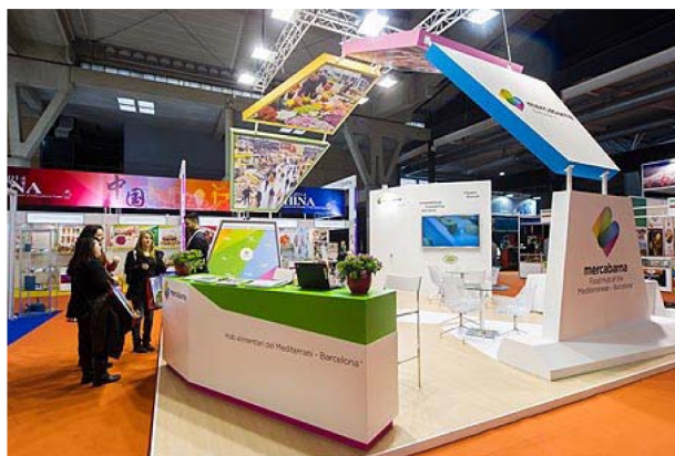
Stand de Mercabarna en Alimentaria 2014.

El día 27 de abril, a las 11 horas, Mercabarna presentará el segundo estudio sobre e-commerce y distribución de alimentos frescos, elaborado por una consultora especializada, que explicará qué ocurre cuando entran grandes operadores de la distribución online en el negocio de la venta y distribución de alimentación fresca. El estudio será presentado en la Sala 1.1 del pabellón CC.1 (Feria Gran Vía).