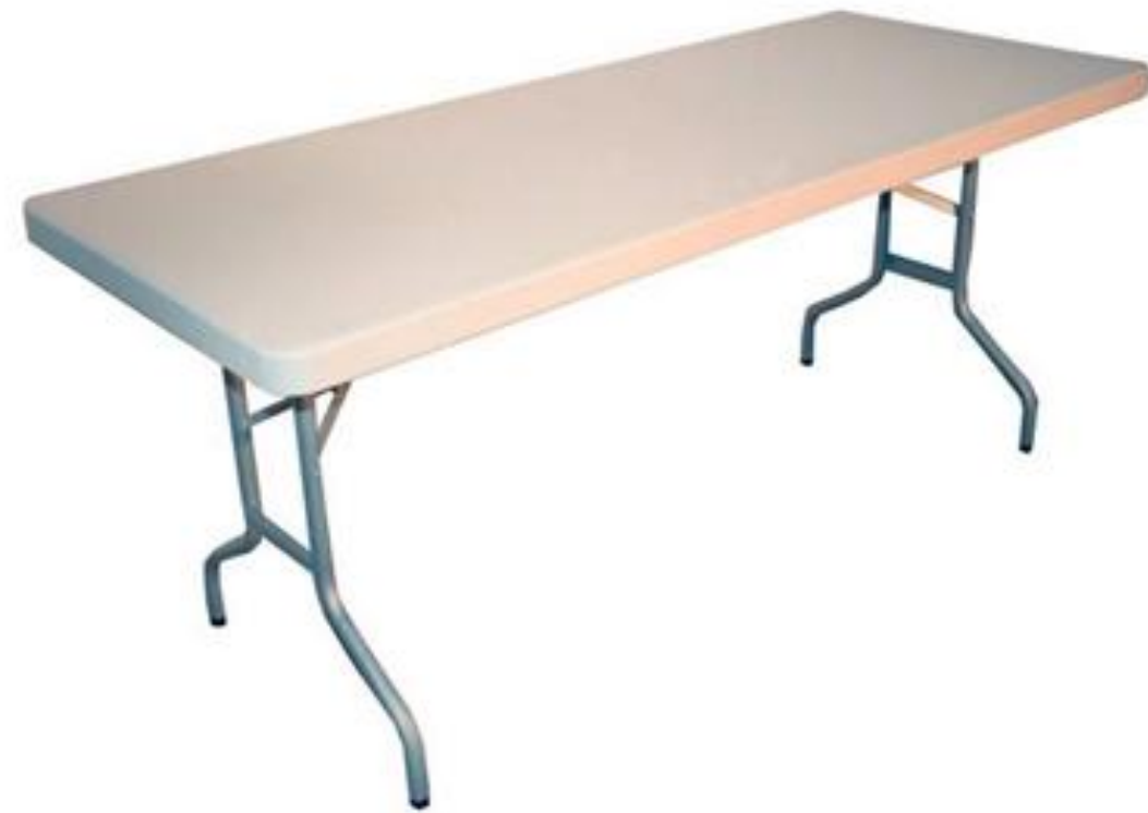
Mesa para la creación del bodegón Medidas 180x75x75