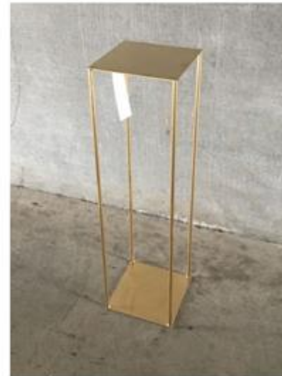
Peana de hierro, color dorado. Medidas 90x25x25