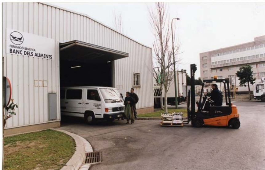
Magatzem del Banc dels Aliments a Mercabarna