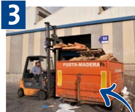
3 La fusta al Carro taronja