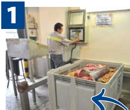
1 La matèria orgànica al Punt de Decomisos

Els usuaris del Mercat Central del Peix han de separar els residus en 4 fraccions i dipositar-los al contenidor del Mercat corresponent: