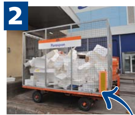
2 El porex i els plàstics a la Gàbia o al Punt Verd