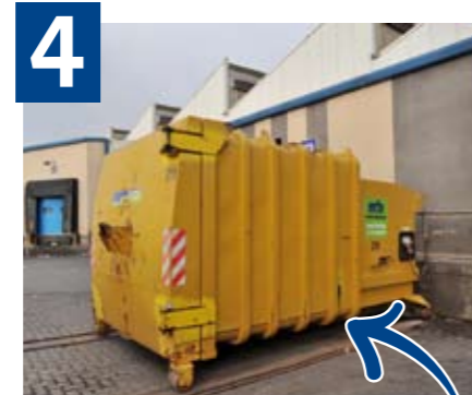
4 La resta de residus (rebuig) al Contenidor-compactador groc